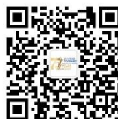
公会北京代表处公众号