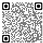
获认可硕士课程介绍